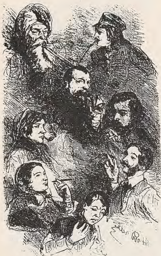
Afb. 2 Titelblad uit Les Fumeurs de Paris, 1856